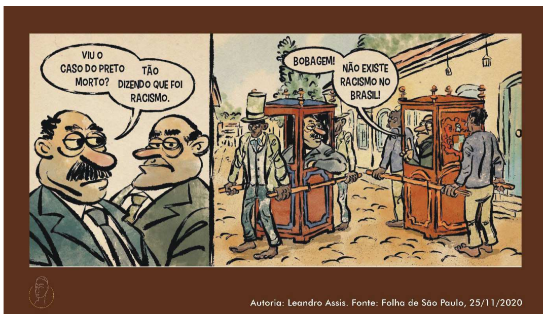
Figura 3: Charge de Leandro Assis na exposição Brasil decolonial: outras histórias

Fonte: Oscar Liberal e Francisco Moreira da Costa (2023). Acervo MHN.